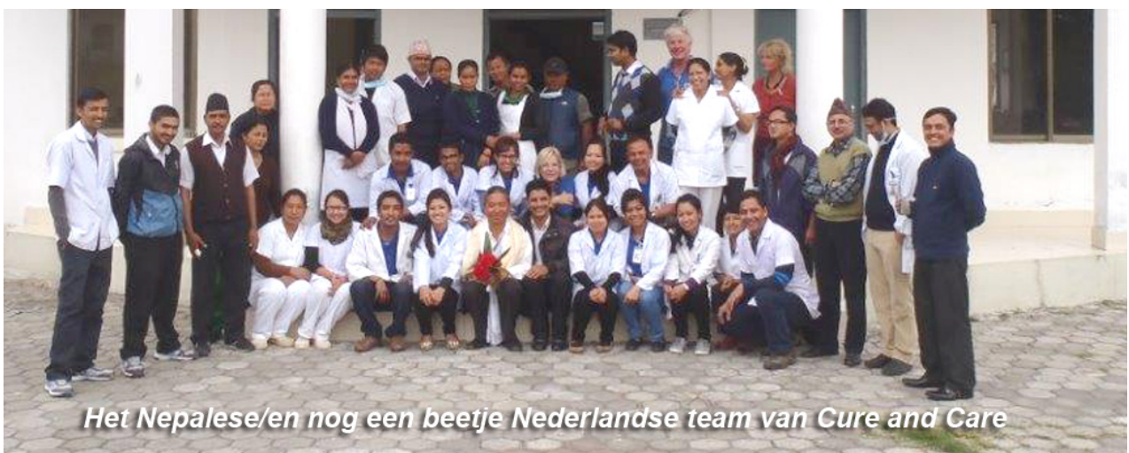
Het Nepalese/en nog een beetje Nederlandse team van Cure and Care

Zij zorgen voor de nodige medische toelatingspapieren, de accommodatie, en vragen de Nepalese medici belangeloos mee te werken.